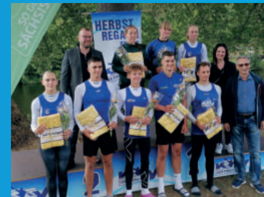
Die erfolgreichen Teilnehmer*innen an der Deutschen Meisterschaft 2023