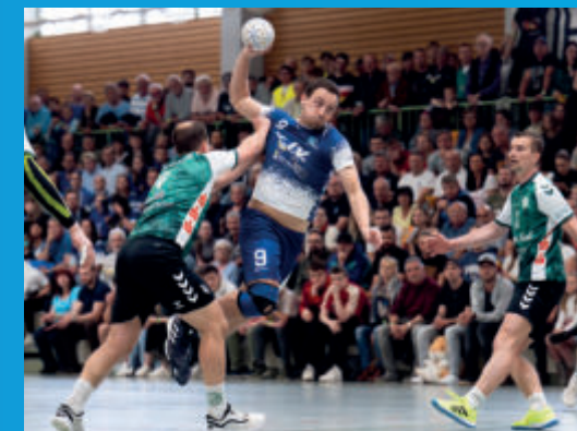
Die Pleißentaler Otter in Aktion