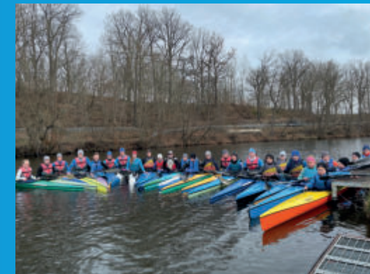
Anpaddeln beim KSV Flöha

Wenn auch Sie, Ihre Kinder oder Enkel einmal in diese faszinierende Sportart reinschnuppern möchten, können Sie die Trainingstage und -zeiten der einzelnen Trainingsgruppen und viele weitere Informationen auf der Webseite einsehen: ksv-floeha.de