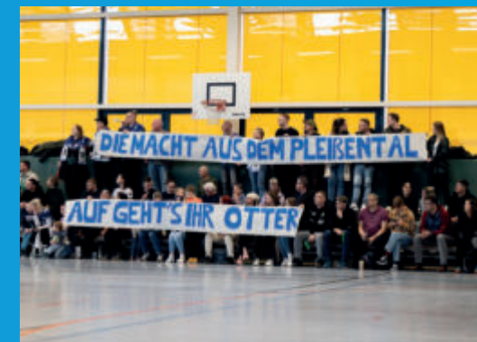
Die Fans stehen hinter ihrer Mannschaft

Mehr Infos hier: facebook: hcpleissental instagram: hcpleissental